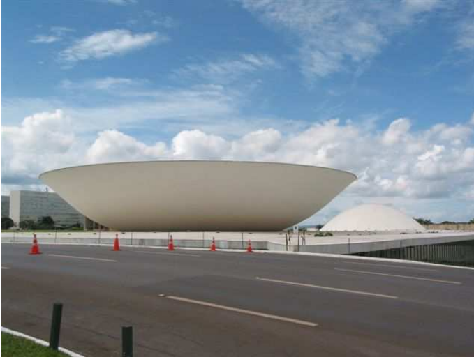
Brasilia-palazzo del governo di domenica pomeriggio e sulla strada pluricorsia a senso di marcia neanche un cane...