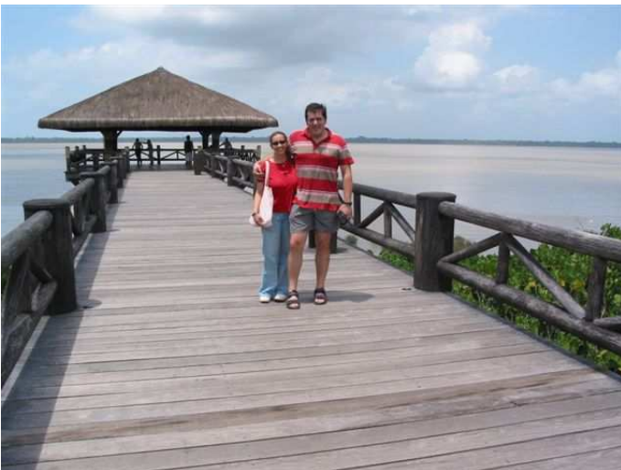
Alla faccia del freddo natalizio... (p.s. è Bèlem e non Redenção...)