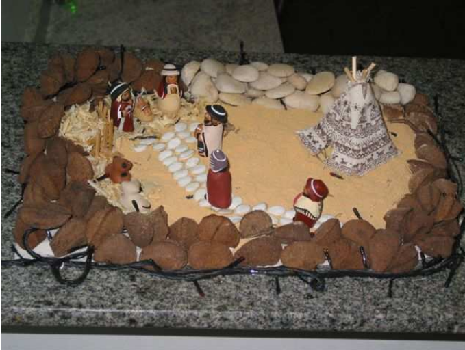
Presepio della casa...