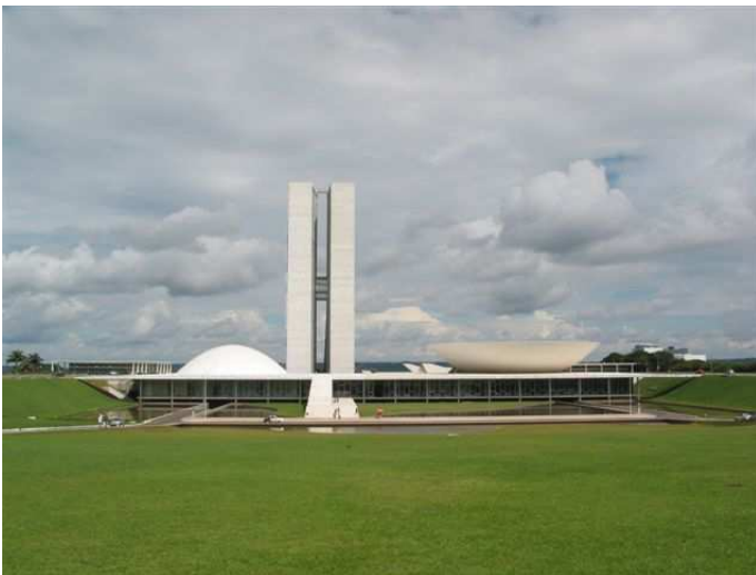
Brasilia-palazzo del governo