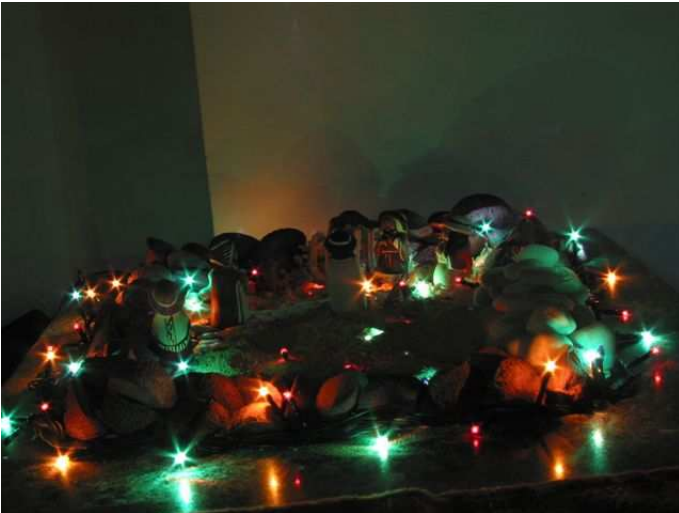
Con effetti speciali notturni... (primo premio presepio più lontano... aspettiamo la commissione giudicante...)