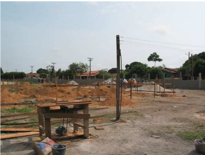
Potenti apparati tecnici a disposizione delle maestranze