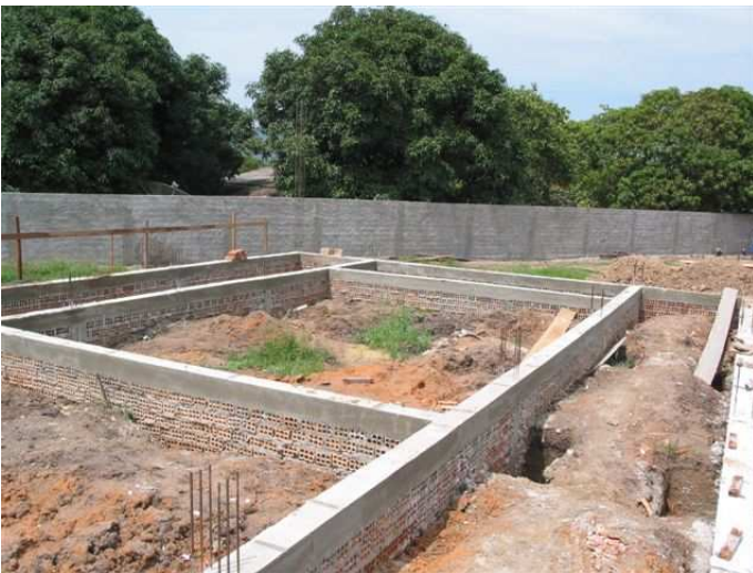
Comparsa prime aule...