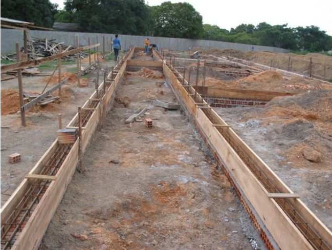
Fondazioni (per gli addetti ai lavori ci sono anche i plinti al disotto...)