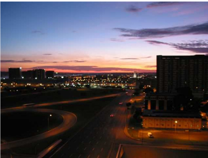
Alba a Brasilia